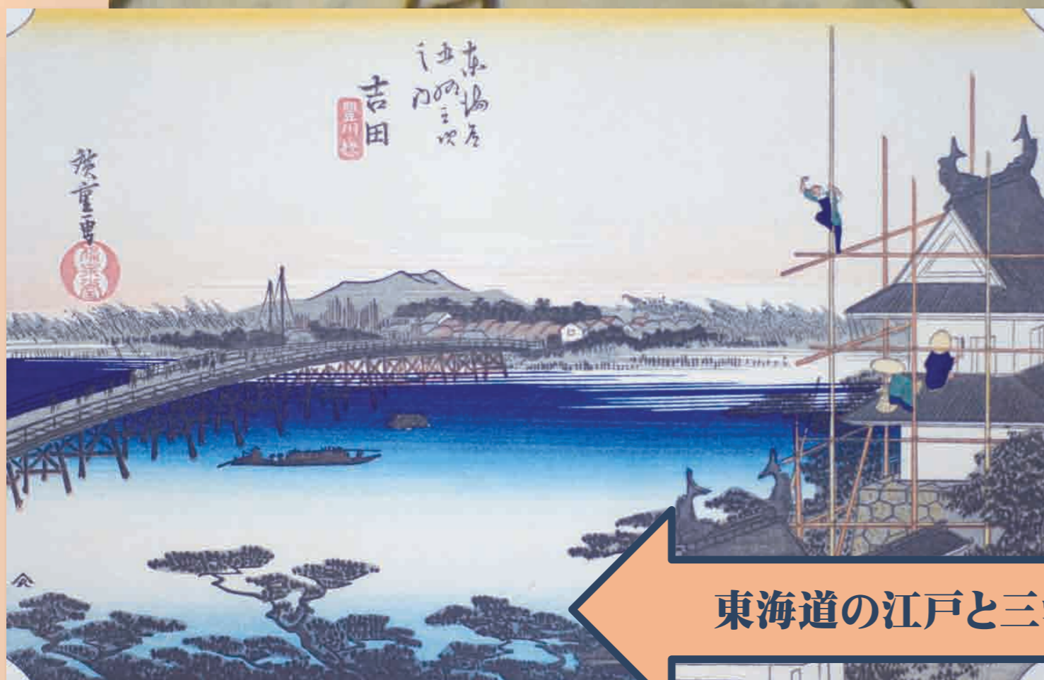
歌川広重「東海道五十三次」三河国吉田宿(愛知県豊橋市)