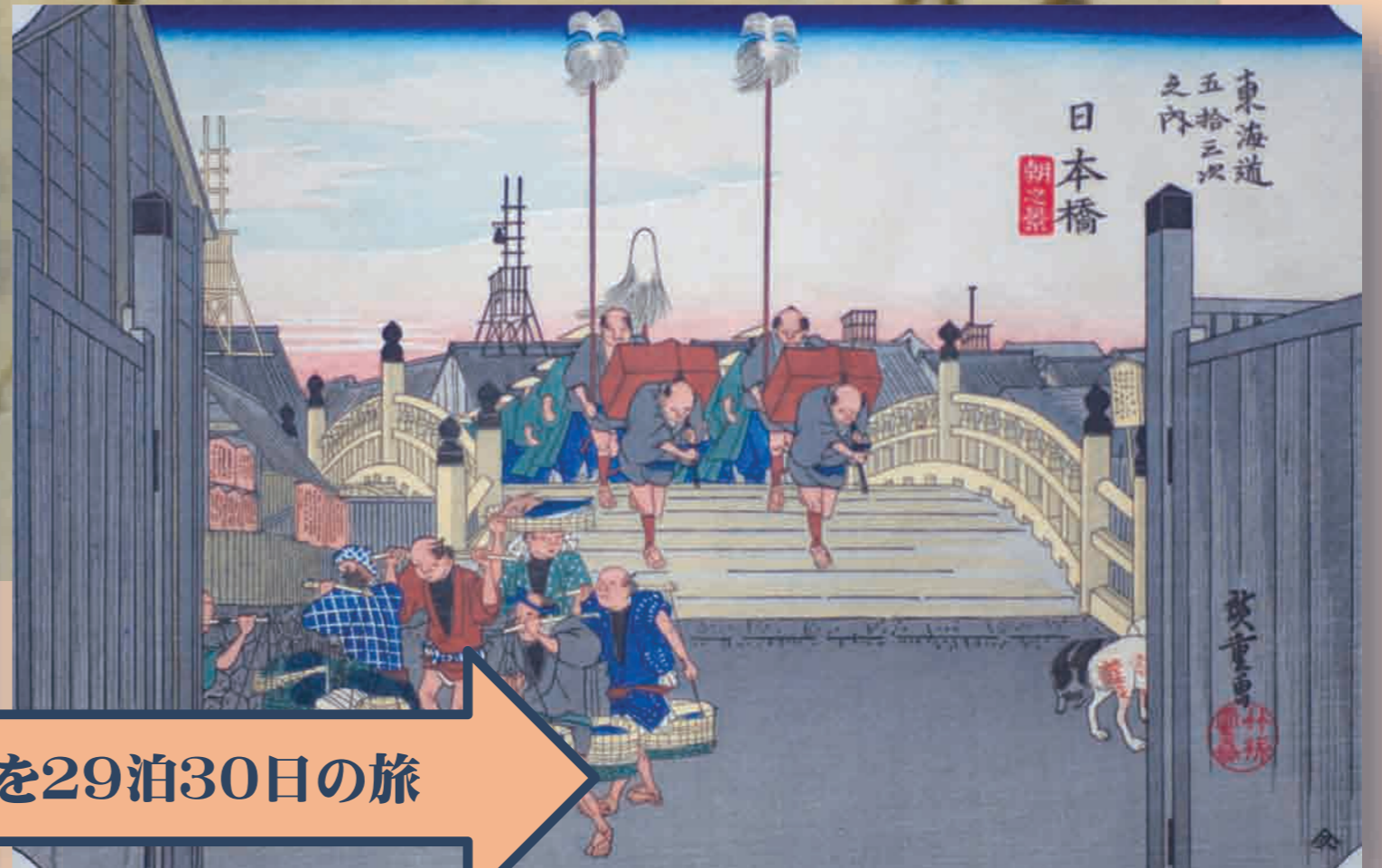
歌川広重「東海道五十三次」江戸日本橋(東京都中央区)